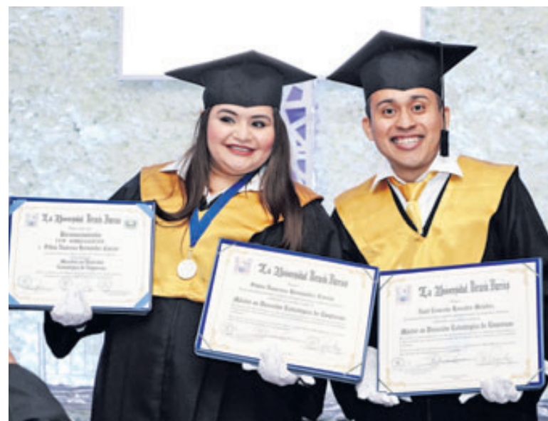
Durante cuatro décadas la UGB ha graduado a 18,090 profesionales, que con sus carreras han impulsado el desarrollo de la zona oriental del país.