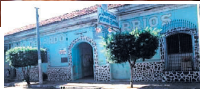
La Universidad Gerardo Barrios (UGB) se fundó el 5 de diciembre de 1981 en el Centro Histórico de la ciudad de San Miguel y comenzó sus actividades educativas con cuatro facultades y ocho carreras. En la imagen se muestra la primera instalación que tuvo la institución.

Son esas personas quienes la han hecho fuerte, son quienes la han hecho crecer mucho más allá de lo que vislumbra hace 40 años y es gracias a ellos que sigue en pie y ha resistido en estos dos años tan plagados de dificultades e incertidumbre, pero desbordantes de oportunidades. Su esencia resiliente y tenaz es resultado de una maravillosa combinación de la propia esencia de cada uno de sus miembros, tanto del equipo como de sus amados estudiantes. A partir de este momento, sin duda, le espera un camino difícil, un sendero de cambios y transformaciones. No obstante, estoy seguro de que la universidad con-