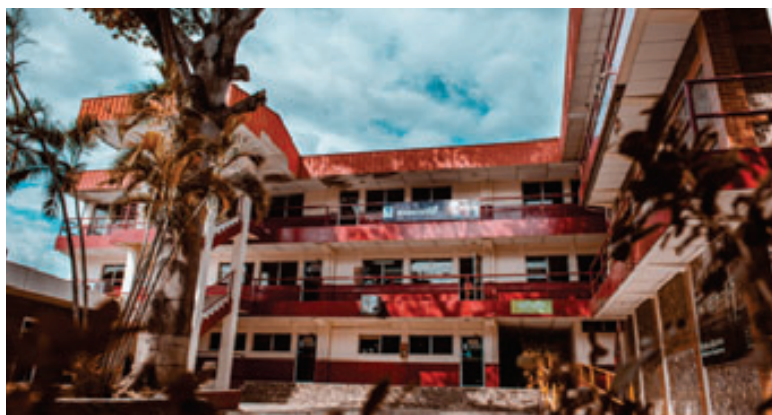
La UGB cuenta con edificios inteligentes, con tecnología de punta y rodeados de naturaleza.

mundo, reinventándote hacia la tecnología sin perder jamás tu humanidad y construyendo una educación más cercana, dinámica y sostenible. Finalmente, no me queda más que decirte a ti, querida Universidad Gerardo Barrios, que, aunque ha pasado el tiempo, sigues más fuerte, estoy seguro de que seguirás creciendo y transformando vidas e impactarás generaciones por siempre”.