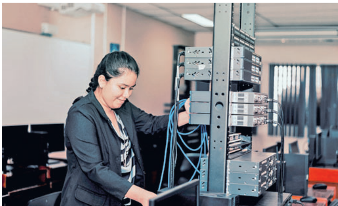
La Universidad Gerardo Barrios se destaca por estar a la vanguardia de la tecnología y para impulsar un alto nivel educativo.

La UGB está comprometida en crear las condiciones que permitan a cada uno de sus estudiantes desarrollar su potencial para poner en práctica su propio proyecto de vida, que reciban una educación con alma en la que los valores como el respeto, la empatía, la igualdad y la solidaridad sean la base preparándolos, no sólo para la subsistencia sino, para la vida.